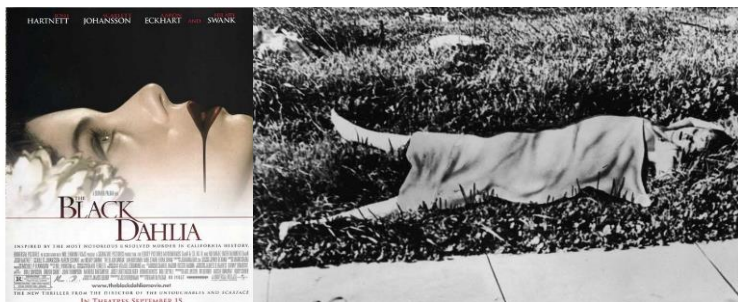
Virkeligt mordfoto af Elizabeth Short; bestialsk og grimt overfor plakaten til filmatiseringen af hendes historie, hvor hun er æstetiseret og gjort smuk.