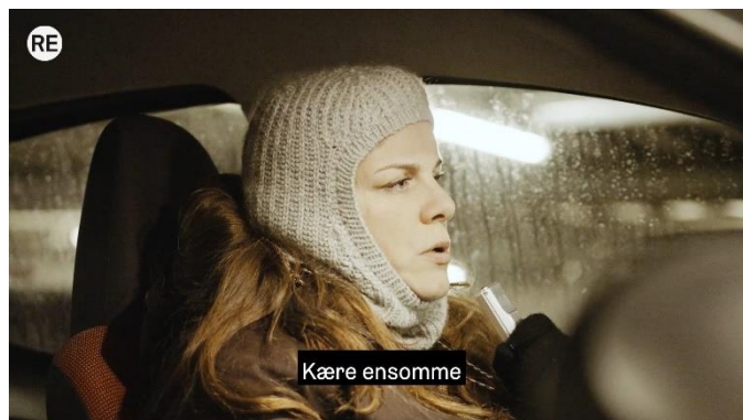
Meter i sekundet, Revolver play (2021)